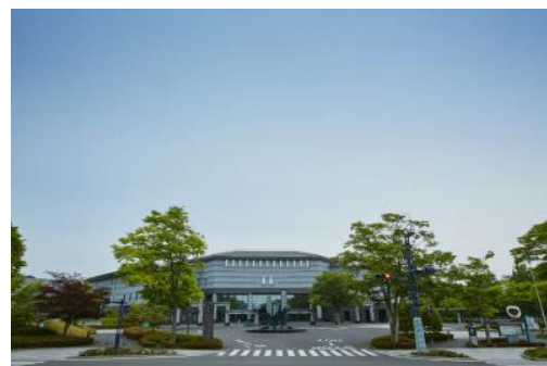
仙台国際センター