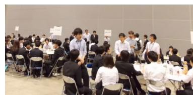
イブニングカフェ